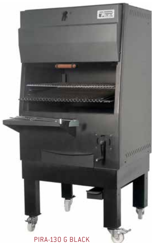
PIRA-130 G BLACK