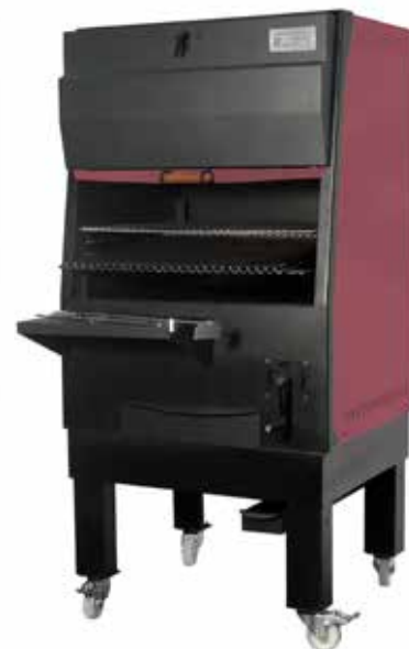
PIRA-130 G CLASSIC