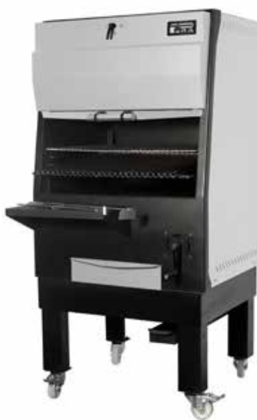
PIRA-130 G INOX