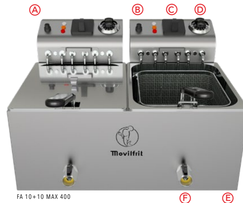
FA 10+10 MAX 400