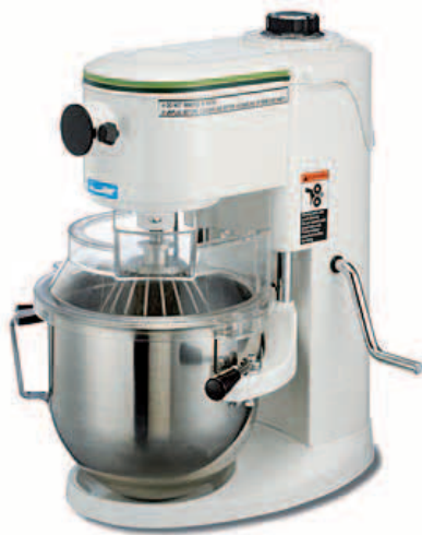
Modelo P.V.P. BM-5..... 769 €