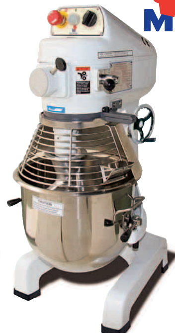
Modelo P.V.P. BM-42 ..... 3.618 € BM-42C* ..... 3.713 € *C: Combinada