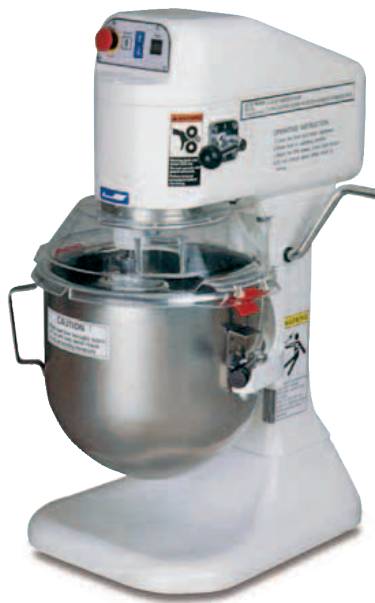
Modelo P.V.P. BM-8..... 995 €

Amasadora de tamaño compacto, diseñada para cocinas y restaurantes. Funcionamiento mediante transmisión por engranajes en acero resistente al calor. Motor de 1HP y 10 velocidades variables.