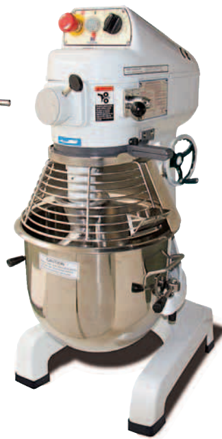
Modelo P.V.P. BM-30 ..... 2.939 € BM-30C* ..... 3.068 € *C: Combinada