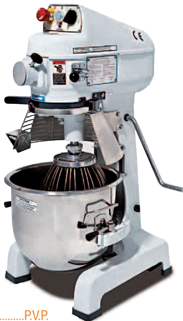
Modelo.....P.V.P. BM-11C* .....1.785 € *C: Combinada