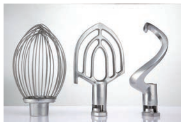
Modelo P.V.P. ER-BM22-10 I ..... 499 € ER-BM26-10 I ..... 620 € ER-BM30-20 I ..... 833 € ER-BM45-20 I ..... 1.050 €