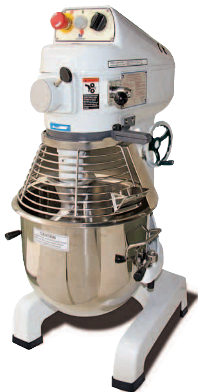
Modelo P.V.P. BM-45C* ..... 3.945 € *C: Combinada

Funcionamiento mediante transmisión de engranaje directo en acero inoxidable a 3 velocidades. Doble microinterruptor de seguridad. Caldero inoxidable con asas de fácil manejo. Subida y bajada del caldero mediante palanca o volante.