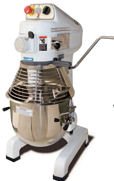
Modelo P.V.P. BM-26HIC* ..... 2.375 € *C: Combinada