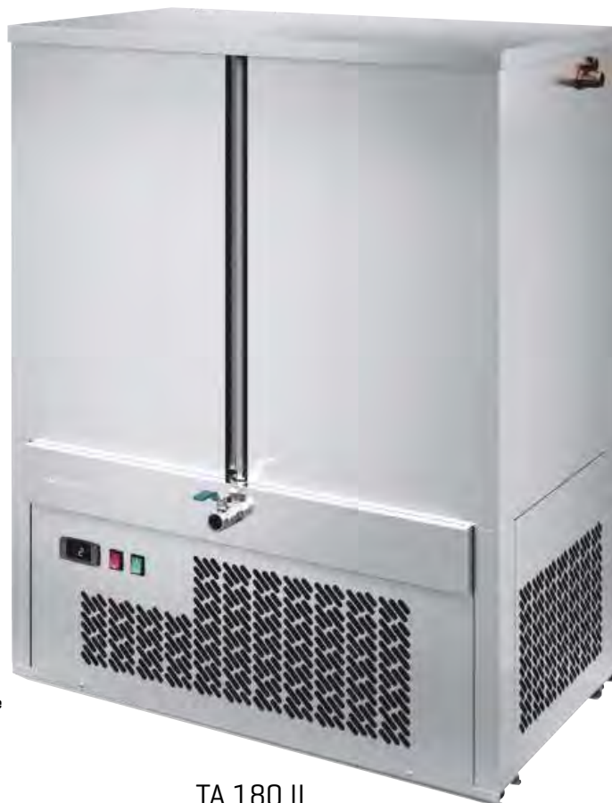
TA 180 II

Opción Kit filtro de agua Option Kit water filter Optionel Kit filtre à eau