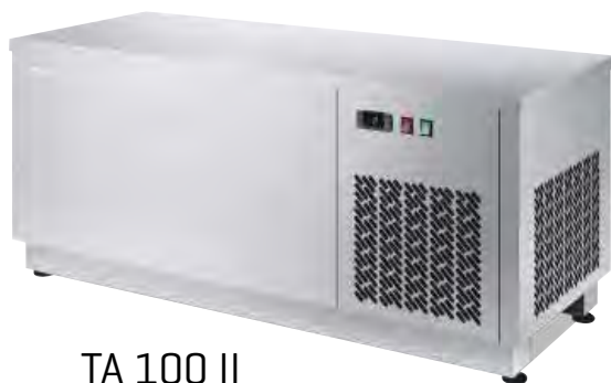
TA 100 II