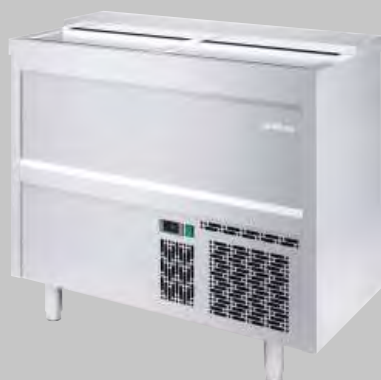
EB 1000 II