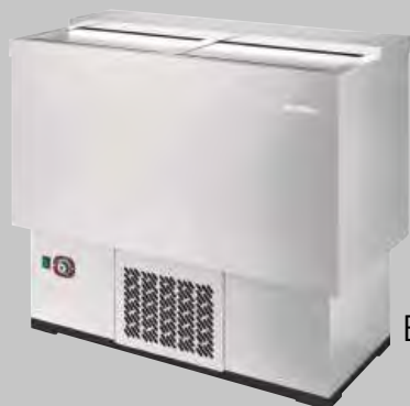
EFP 1000 II