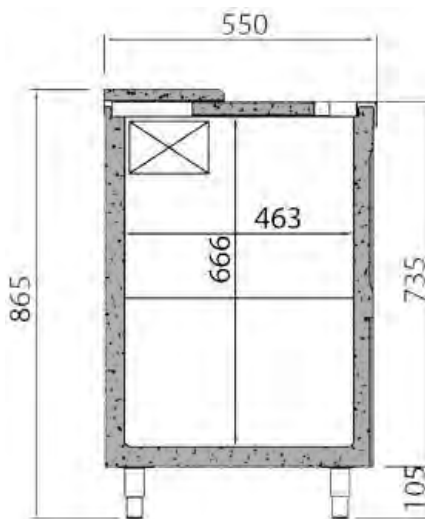
EFP / EB