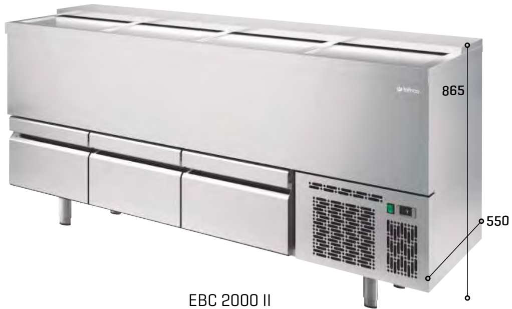
EBC 2000 II