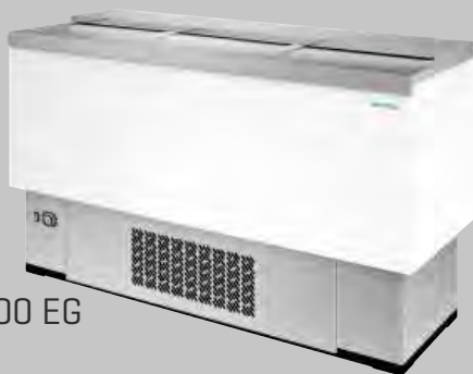
EFP 1500 EG