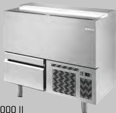
EBC 1000 II