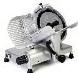
C 350 SCEV