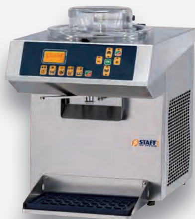
Mod. RT 51A