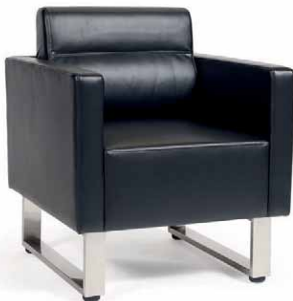
▶▶ SILLÓN MOD. STRAUSS P.U. NEGRO PIE ACERO