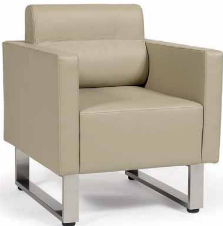
▶▶ SILLÓN MOD. STRAUSS P.U. KASHMIR PIE ACERO