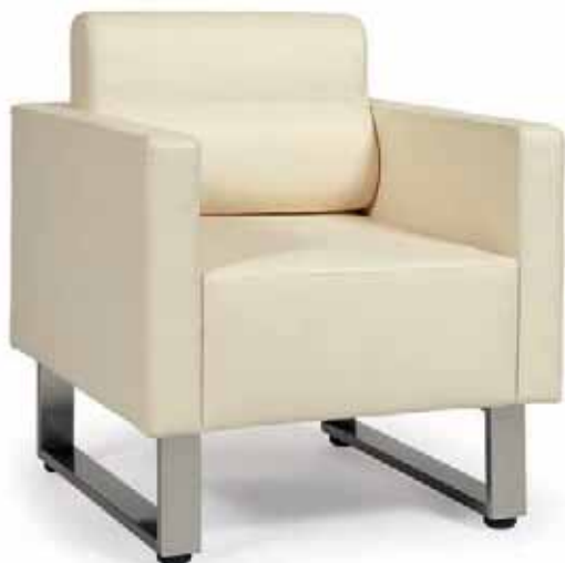
▶▶ SILLÓN MOD. STRAUSS P.U. BLANCO PIE ACERO