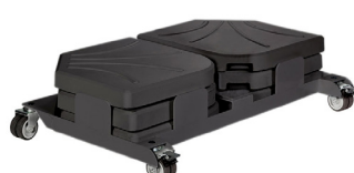
BSH990ANK FLEXO+SLABx6 Anthracite