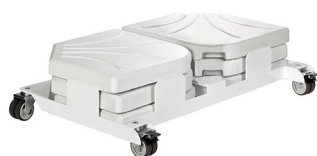
BSH990BCK FLEXO+SLABx6 White