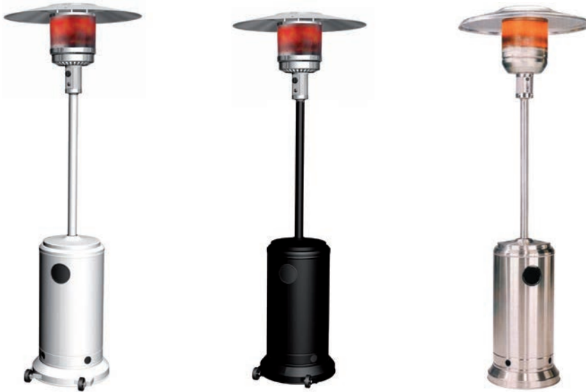
CORONA en colores Blanco, Negro e Inox