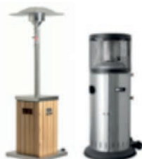
Cosy Bois y Cosy Polo Inox