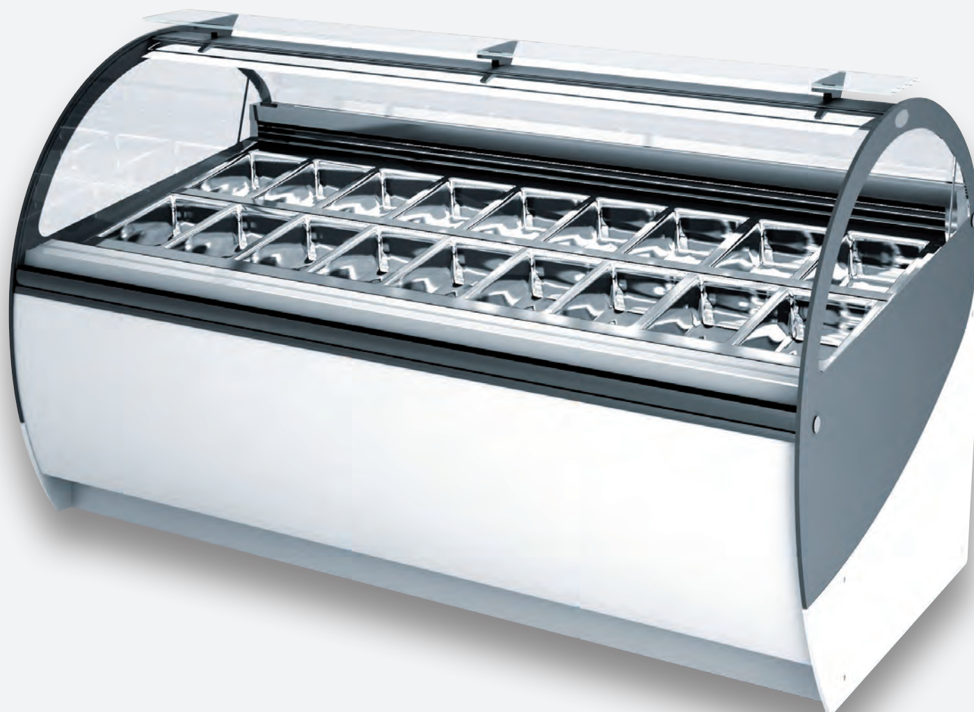
Mod. MOON 2V 18H