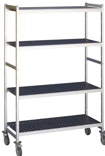
ESTANERÍA CON RUEDAS SHELVING WITH CASTORS