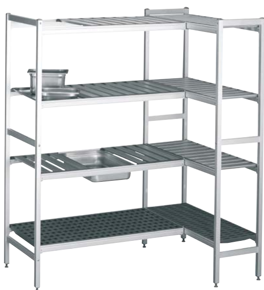
CONJUNTO ESTANERÍAS SHELVING ASSEMBLY