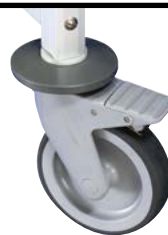
RUEDA CON FRENO CASTOR WITH STOP