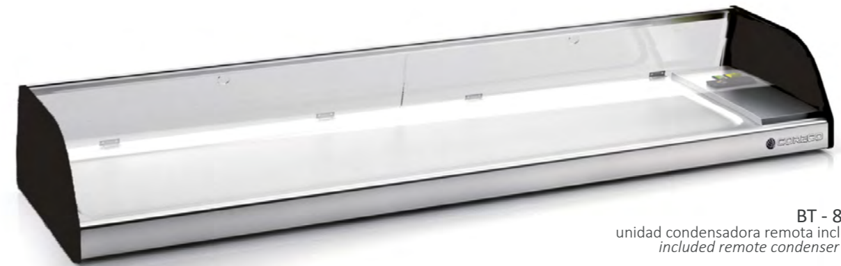
BT - 8 - R unidad condensadora remota incluida included remote condenser unit

Características técnicas y constructivas sujetas a variación sin previo aviso.