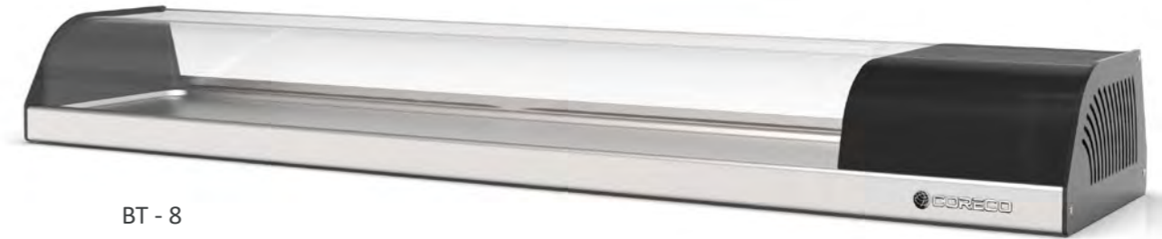
BT - 8

* no disponible mercado UE - not for EU market