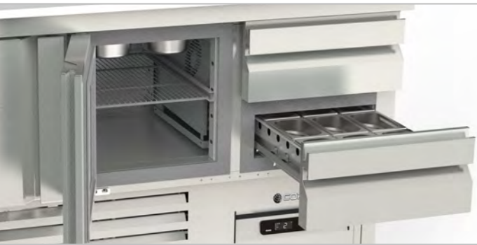
evaporador central double fan evaporator