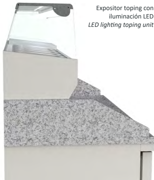
Expositor topping con iluminación LED LED lighting topping unit