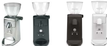
MIN.300/311 Aluminio Pulido MIN.301/310 Negro MIN.330 Negro MIN.331 Blanco