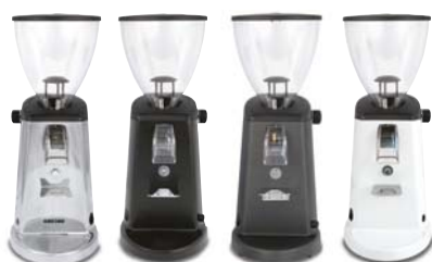
MIN.1 Aluminio Pulido MIN.21 Negro MIN.41 Antracita MIN.61 Blanco