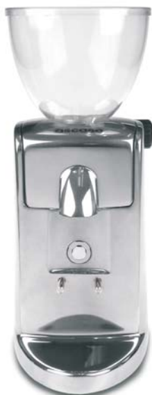
i-mini Aluminio ó ABS