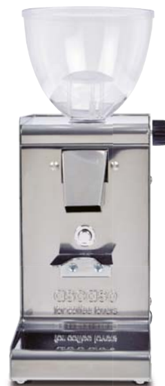
i-steel Inox 100% 2 acabados: Mate/Brillante