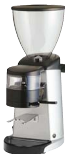
i-1d/i-2d [125 gr] Dosificador Bandeja extraíble