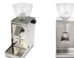
MIN.400/500 Brillante MIN.405/505 Mate