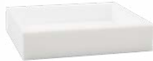
506317 Jabonera blanco mate en acrílico Acrylic matt white soap dish