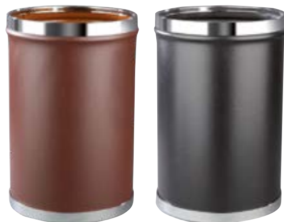
501204 Marrón / Brown