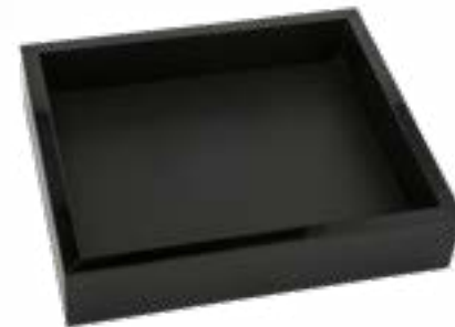
506316 Jabonera negro mate en acrílico Acrylic matt black soap dish