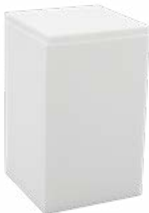
506313 Algodonera blanco mate en acrílico Acrylic matt white cotton container