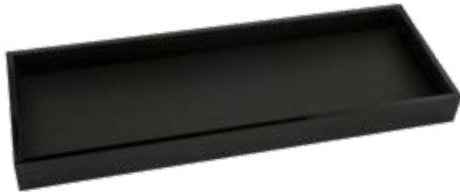
506314 Bandeja de servicio negro mate en acrílico Acrylic matt black amenity tray