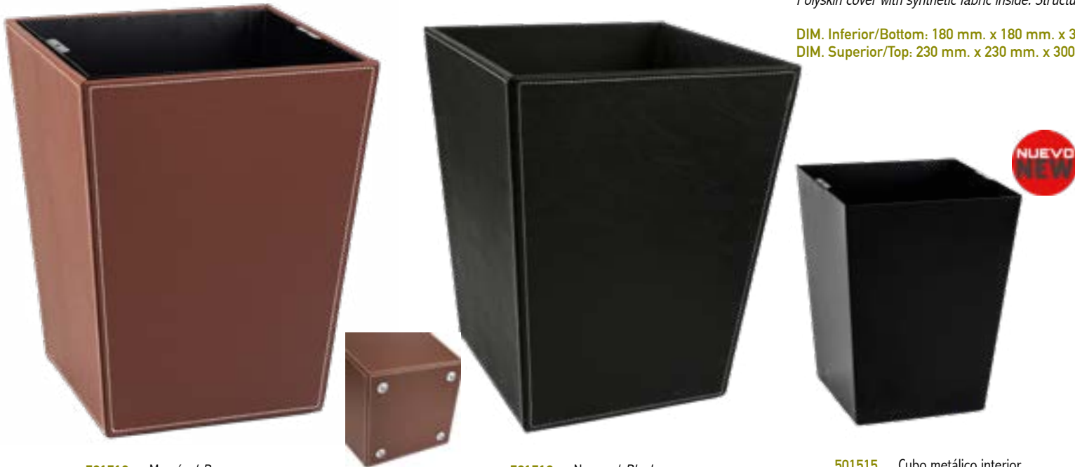
501512 Marrón / Brown

DIM. Inferior/Bottom: 180 mm. x 180 mm. x 300 mm. DIM. Superior/Top: 230 mm. x 230 mm. x 300 mm.