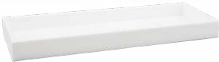
506315 Bandeja de servicio blanco mate en acrílico Acrylic matt white amenity tray