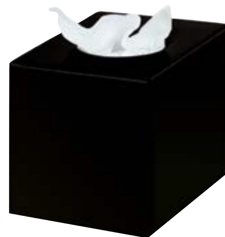
503803 Dispensador tipo cubo toallitas higiénicas negro mate