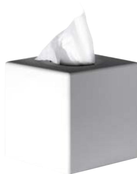
503804 Dispensador tipo cubo toallitas higiénicas blanco mate