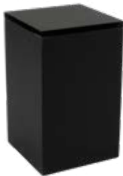
506312 Algodonera negro mate en acrílico Acrylic matt black cotton container